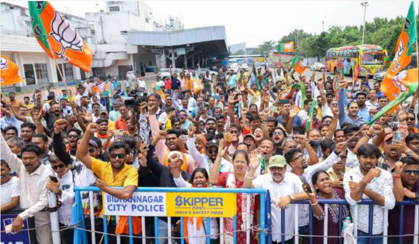
ఏప్రిల్ 26 - కమలవాణి