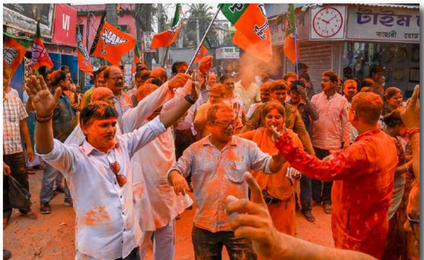
ఏప్రిల్ 26 - కమలవాణి

యం ఎన్నికల కౌంటింగ్ ప్రారంభమైనప్పటి నుంచే భాజపా అధిక్యంలో ఉంది. అక్కడ ఇక్కడ అని కాకుండా సరిహద్దుల్లో, గిరిజన ప్రాంతాల్లో, పారిశ్రామిక కారిడార్లలో భాజపా హవా కొనసాగింది. కోల్‌కతాతోపాటు కొన్ని గ్రామీణ ప్రాంతాల్లోనే తృణమూల్ కొన్ని విజయాలను సాధించగలిగింది. బెంగాల్‌లో మెజారిటీ మార్కు 148 కాగా.. భాజపా 206 సీట్లు సాధించింది. తృణ మూల్ 81 సీట్లకే పరిమితమైంది. తృణమూల్ అధినాయకురాలు, వరుసగా 15 ఏళ్లు సీఎంగా ఉన్న మమతా బెనర్జీ తనకు కంచుకోటలాంటి భవానీపూర్ నియోజకవర్గంలో ఒకప్పటి తన సన్నిహిత అనుచరుడైన ప్రస్తుత భాజపా కీలక నేత సువేందు అధికారి చేతిలో పరాజయం పాలవడం తాజాఎన్నికల్లో మరో సంచలన పరిణామం. ఆమె 15,015 ఓట్లతోడూ ఓడిపోయారు. సువేందు నందిగ్రామ్‌లోనూ గెలిచి, ఆ నియోజకవర్గంపై తనకున్న పట్టును మరోసారి నిరూపించుకున్నారు. ఆమెతోపాటు దాదాపు 20 మంది మంత్రులు ఓడిపోయారు. సువేందు అధికారి రెండు చోట్లా విజయం సాధించారు. ఎన్నికల ఫలితాలు వెలువడుతున్న సమయంలో మమతా బెనర్జీ తీవ్ర అసహనానికి గురయ్యారు. చివరి వరకూ వేచి ఉండాలని, విజయం తమదేనని మధ్యాహ్నం సమయంలో వీడియో సందేశంలో