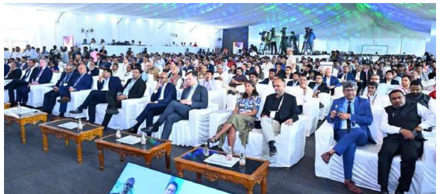
ఏప్రిల్ 26 - కమలవాణి